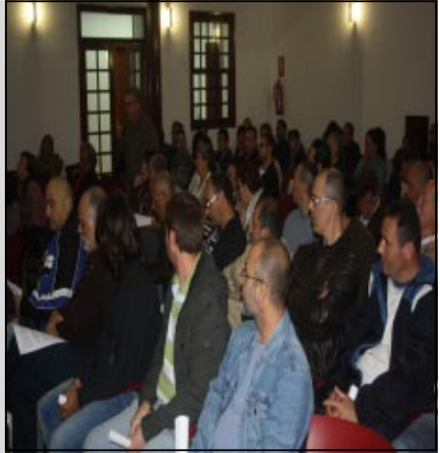
como se puede apreciar en la foto el aforo fué máximo

La Asamblea acordó realizar una marcha obrera el próximo día 18 de Marzo a las 19:30h. Desde el Parque de San Telmo hasta la sede del Gobierno de Canarias “Contra el paro, los despidos y la precariedad laboral”. Se puso fin a la asamblea con el agradecimiento de todos para todos porque la iniciativa ya es una realidad en marcha hacia delante y por haber logrado los objetivos previstos para la ocasión.