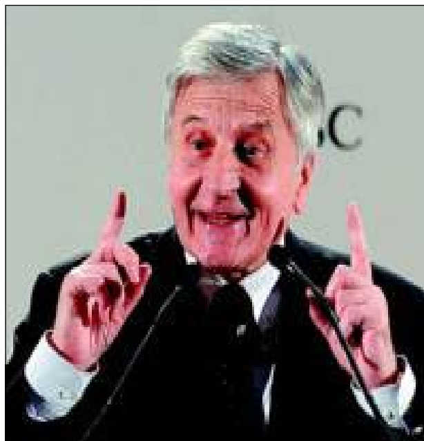
Jean-Claude Trichet, presidente del Banco Central Europeo e inductor de la «jubilación a los 67 años»

Sin embargo, tampoco son “ellos” los que “mandan”, si es cierto que al recibir las órdenes de cómo tienen que administrar nuestro dinero sí salen beneficiados y enriquecidos ilícitamente, especulando con nuestras propiedades, con nuestra salud, con nuestra educación, (¿quién ha visto a un hijo de nuestra oligarquía educándose en un colegio público?, ¿o haciendo cola en la seguridad social?. Lo que nos dedican para nosotros no es para ellos, ellos van a colegios privados de alto nivel, a universidades allá lejos –cuanto más mejor-, a curarse sus achaques a los EEUU, etc, etc.