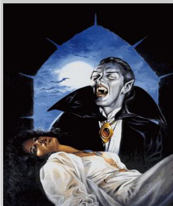
España nos chupa la sangre

Pero tal y como comentamos en este artículo , siendo independientes y explotando nuestros