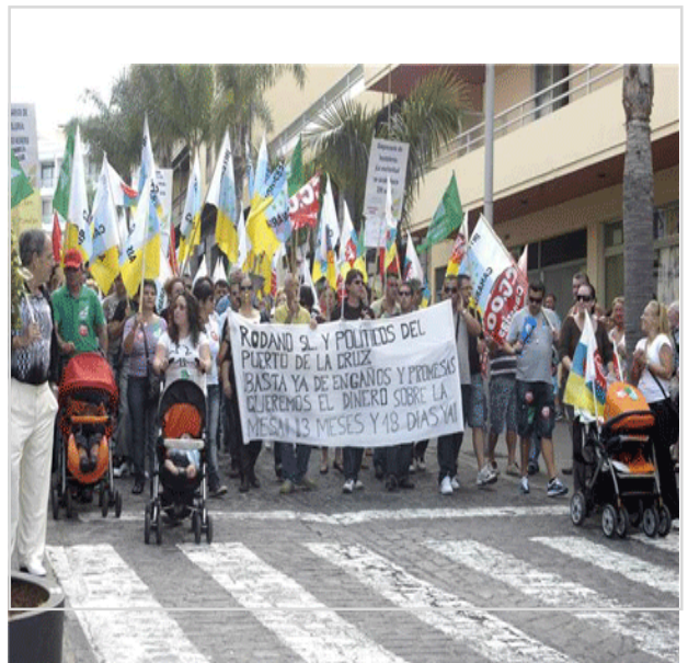
Trabajadores y familiares defendiendo su puesto de trabajo

meramente mediadora y que, en ningún caso, el consistorio puede abonar los sueldos que se les adeudan a los 65 trabajadores de Ródano.